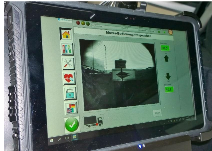
Positionierung über ein Fadenkreuz