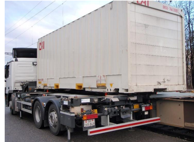
Mover-Umschlag unter der Oberleitung